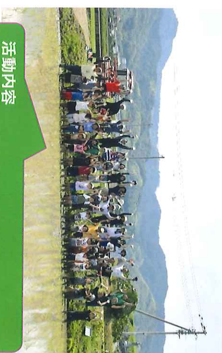
活動内容 どんご祭り・田植え・収穫祭

・将来のことを考え上吾川は防災活動に力を入れながら三世代が融合し、共に支え合い、助け合う地域となり、更に活性化を目指していきたいと思えます。