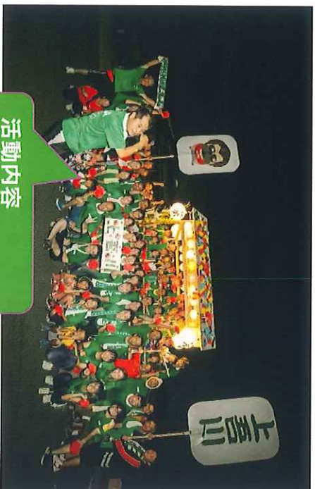
活動内容 伊予彩おどり

伊予彩まつりの前日に行われる伊予彩踊りです。上吾川地区の老若男女で一致団結して踊りに参加しています。