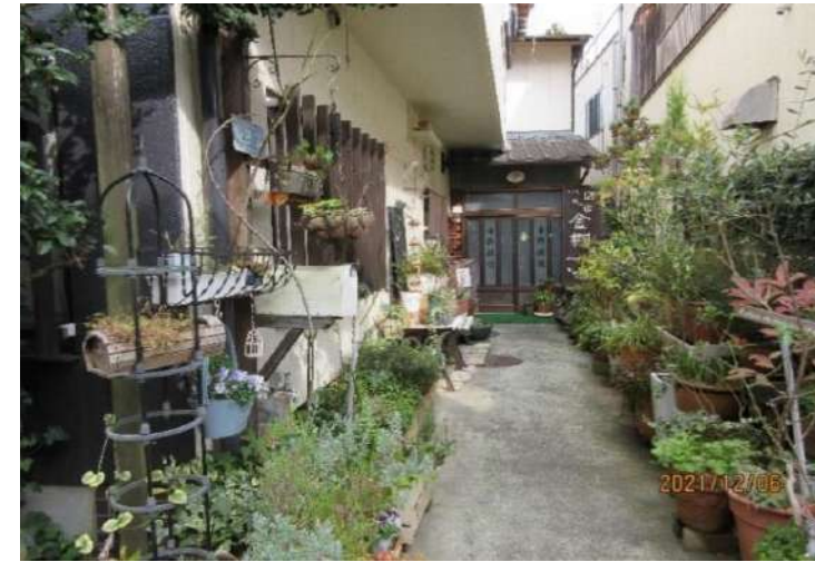
昔ながらの旅館の雰囲気グレトクな感じです。