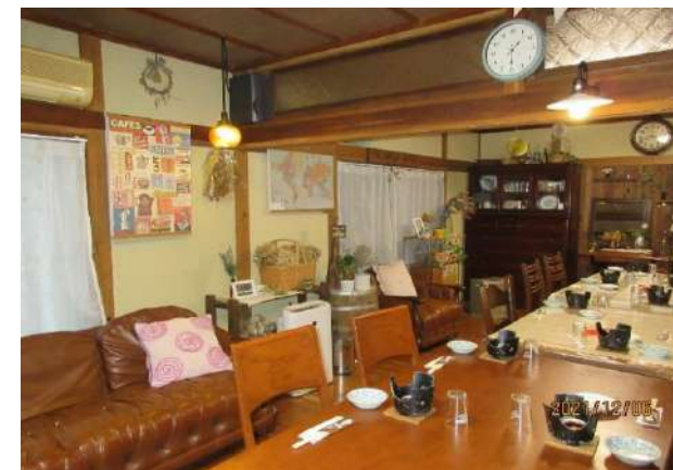
ディナールームは、10人位が利用できる、これもまたレトロでステキなお部屋です。