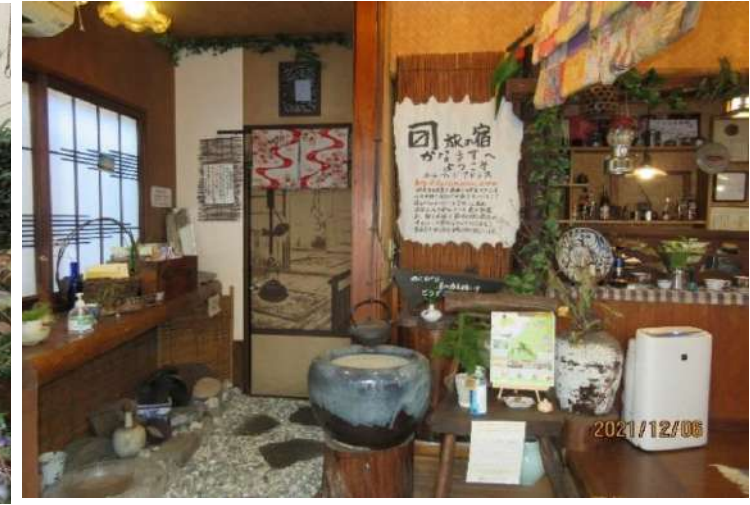
お店に入ると火鉢が暖かくお出迎えしてくれました。