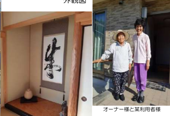
オーナー様と某利用者様