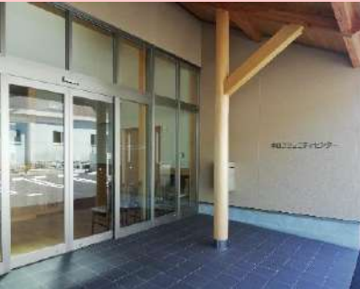
中山生きがい活動センター

子どもから高齢者まで幅広い世代の地域交流の場として利用できる集会所と、介護予防の拠点となる生きがい活動センターを兼ね備えた複合施設が、なかやま農業総合センター跡地に完成し、令和2年9月1日に開所しました。